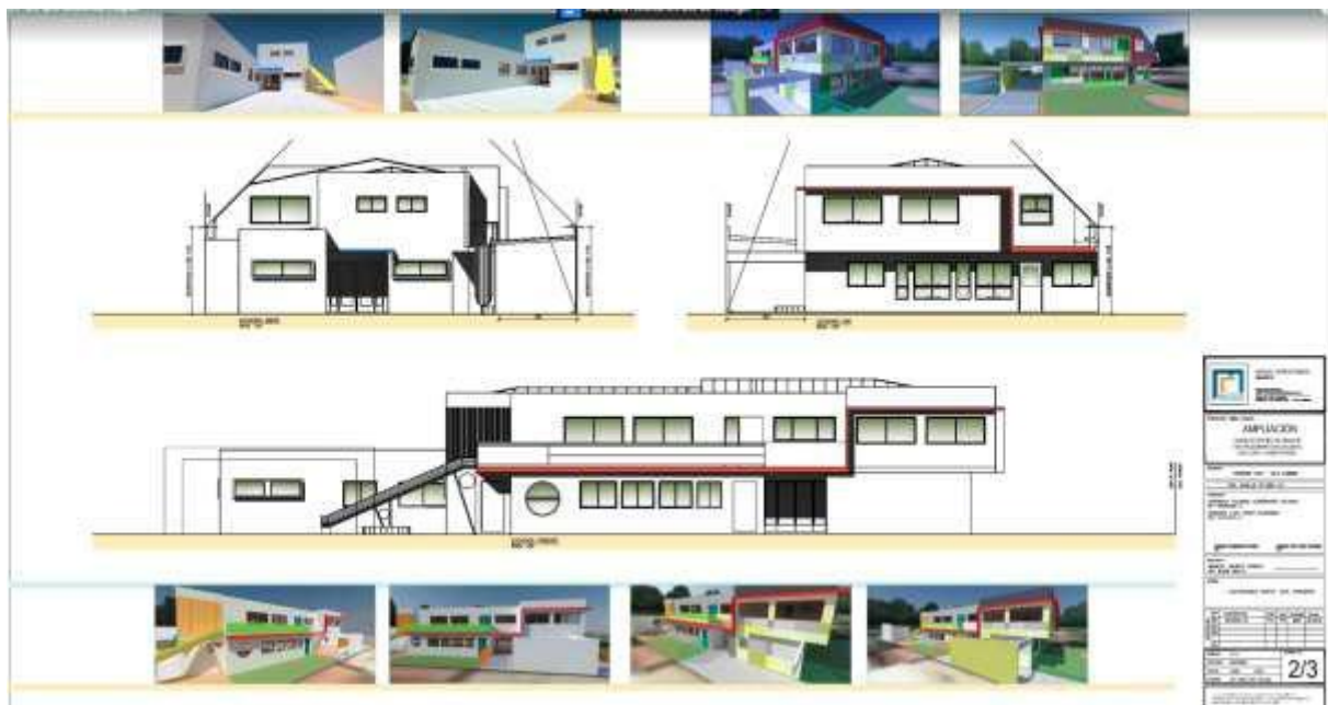
IMAGEN N°1: Frontis del establecimiento de educación parvularia.

A partir del año 2022 y con la finalidad de brindar cada vez un mejor servicio educacional es que se integró un equipo multidisciplinario, formado por Fonoaudióloga, Terapeuta Ocupacional y Psicóloga.